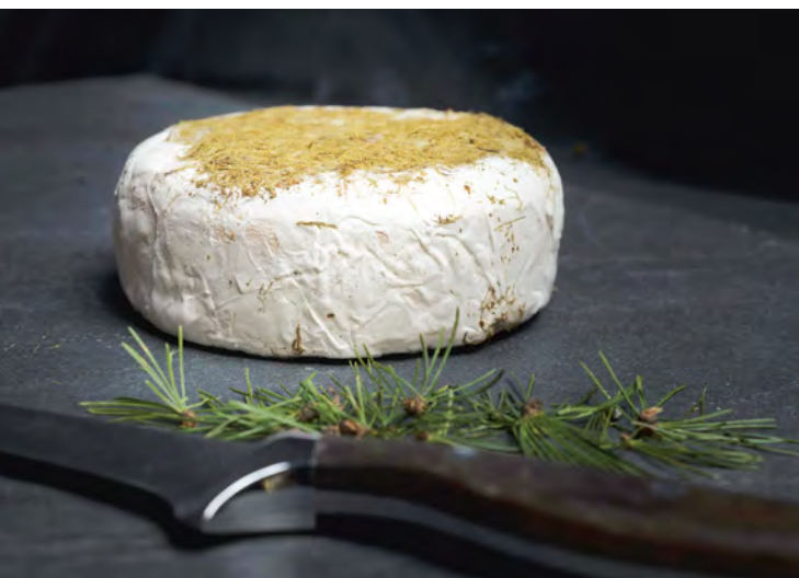
Käse »Larix« von Eggmoa (Seite 40)