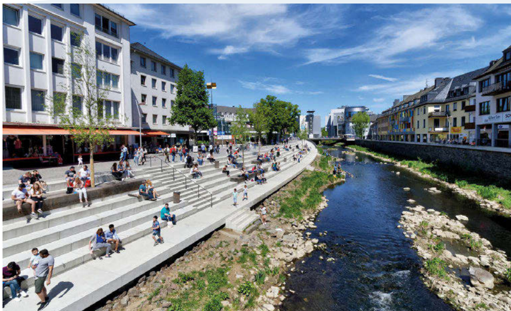
Für Einige unerwartet ist durch die Freilegung der Sieg im Stadtzentrum Siegens ein neues urbanes Zentrum entstanden.

Die Stadt hat durch den Abriss eine Parkfläche verloren, dafür aber ein neues naturnahes innerstädtisches Zentrum gewonnen, einen Ort, der durch den Umbau nicht unattraktiver geworden ist, sondern wegen seiner hohen Aufenthaltsqualität gern und viel genutzt wird.